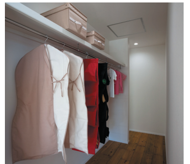
別冊 SUMAIInoSEKKEI「アトリエ建築家とつくるマイデザインハウス」掲載